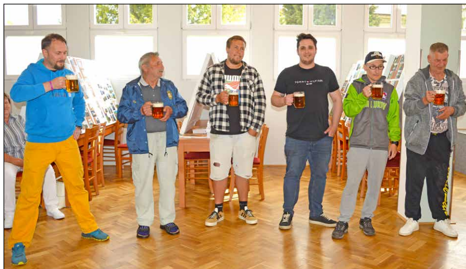
Součástí Štrúdlobraní byla i soutěž v pití půl litru piva.